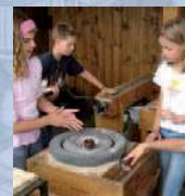
Führungen für Schulklassen und andere Interessierte