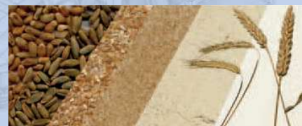
Vorführung der Getreidevermahlung