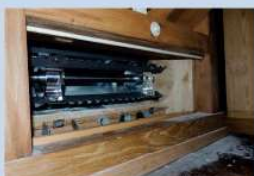
Vorführung der Getreidevermahlung