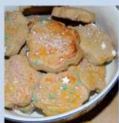
Mühlentaler aus selbstgemahlenem Getreide backen