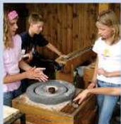
Führungen für Schulklassen und andere Interessierte